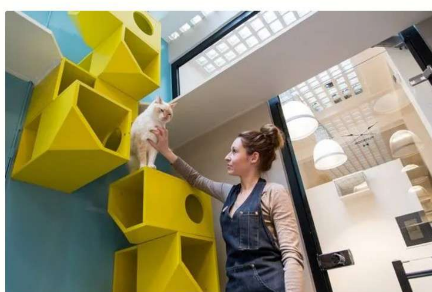
L'hôtel pour chats Aristide est situé à Paris - Riccardo Milani

Car évidemment, faire garder son matou dans ce type de structure, plutôt que de confier ses clés à la voisine ou choisir une pension plus classique, représente un budget : entre 37 et 45 euros pour une chambre individuelle chez Aristide, avec friandise de bienvenue, pension complète et câlins à volonté. A Bordeaux, chez Harmonie Chat, comptez 24 euros par jour, un tarif auquel on peut rajouter des options, comme une pipette anti-puce ou une ration d'herbe à chat. « Le service le plus demandé, c'est l'envoi de nouvelles, explique Christel Borderie, la gérante. J'envoie régulièrement des photos avec un petit texte. C'est important pour nos clients, qui loin d'être uniquement des CSP +, recherchent avant tout le fait de pouvoir partir l'esprit tranquille. »