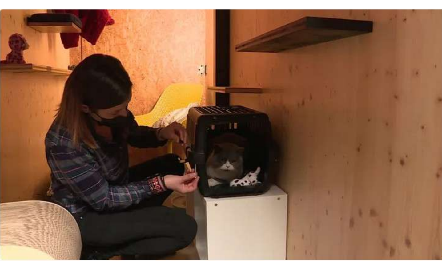
La chambre individuelle coûte 25 euros la nuit.

Et tout est mis en place pour rassurer les propriétaires. Au niveau des repas, il faut apporter la nourriture que le chat à l'habitude de manger pour faciliter la transition alimentaire.