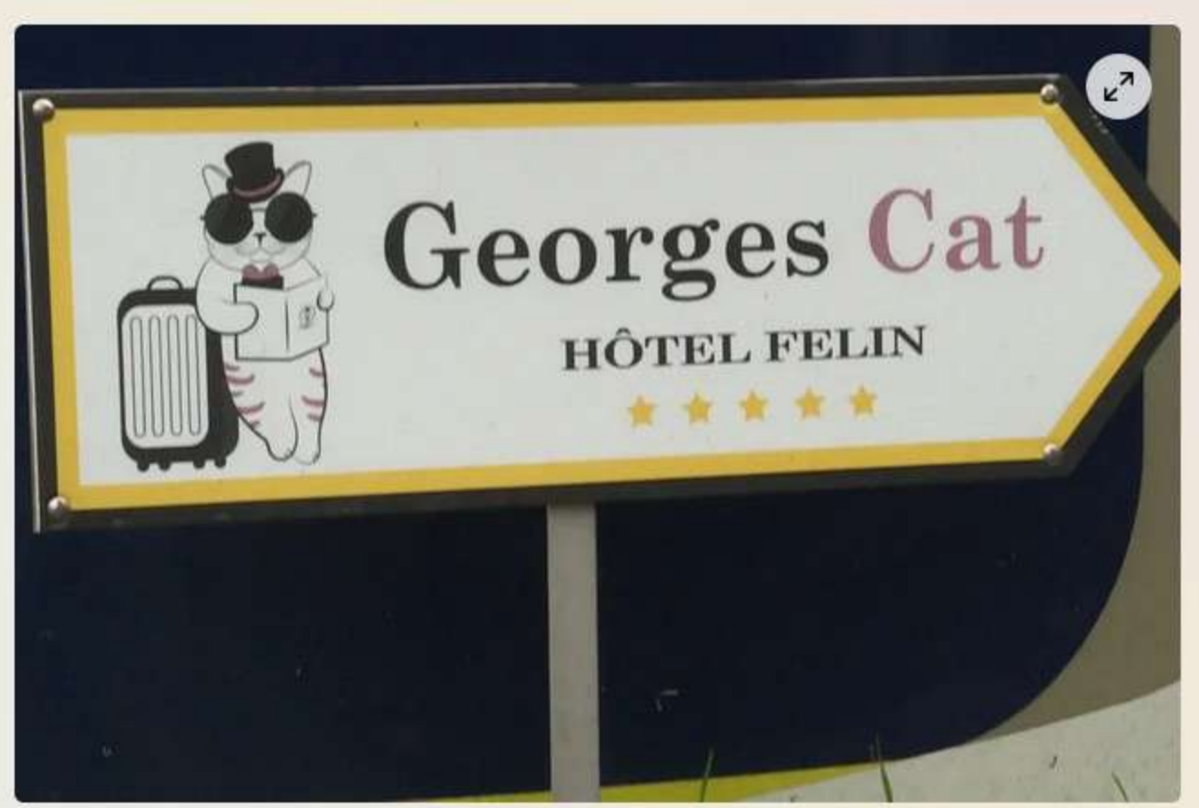
Le Georges Cat est ouvert toute l'année, à Vertou, en Loire-Atlantique.

Écrit par Marion Naumann avec Alix Guiho