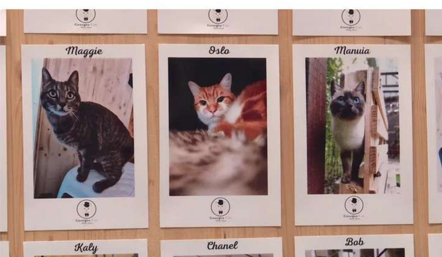
Au Georges Cat, chaque client a droit à son portrait.

Et pour combler le manque... des nouvelles en direct. "On prend de belles photos qu'on envoie aux propriétaires tous les 3-4 jours". Un groupe Facebook privé est également mis à disposition des clients de l'hôtel pour voir ce qu'il s'y passe quotidiennement.